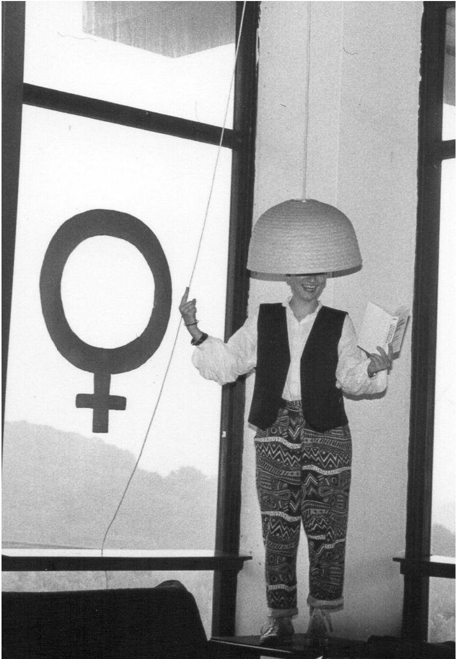
Wiederentdeckt im Digitalisierungsprojekt der Studentischen Frauen*bibliothek Lieselle 2018 im Rahmen des Aufbaus des Digitalen Deutschen Frauenarchivs (DDF).]